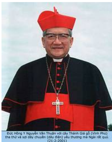
Đức Hồng Y Nguyễn Văn Thuận với cây Thánh Giá gỗ (Vĩnh Phú) tha thứ và sợi dây chuyền (dây điện) yêu thương mà Ngài rất quý. (21-2-2001)